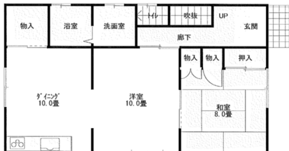
この平面図は参考としていただき現況を優先と致します。